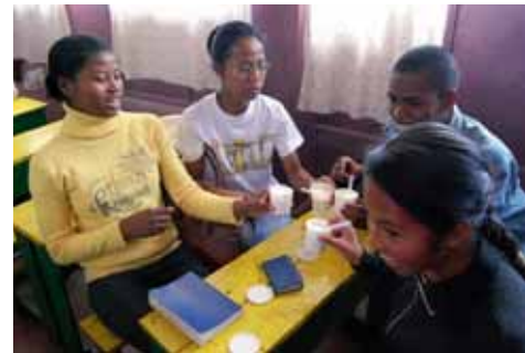
Etudiants bénéficiaires de bourses d'études

Ankazomanga est un quartier de la capitale. C'est là que Dédé et Odile Rabenifara ont créé le Centre d'Entraide des Enfants d'Ankazomanga. Plus de 195 enfants y sont parrainés. Le SEL Projets y soutient d'autres actions, telles l'octroi de bourses d'études, le soutien financier du personnel et le projet d'agrandissement du bâtiment du centre devenu trop petit.