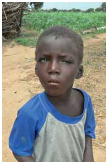
Enfant atteint de la cataracte

La cataracte est la maladie oculaire la plus fréquente. Elle est essentiellement liée au processus de vieillissement. Mais dans les pays en développement, elle touche malheureusement aussi énormément d'enfants à cause de la dénutrition, de la déshydratation et de l'exposition au soleil.