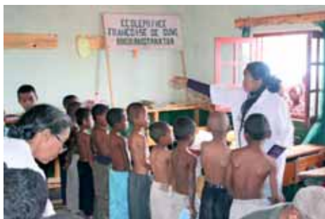
Le soutien alimentaire va de pair avec un suivi médical

C'est pourquoi, pendant une semaine avant la rentrée scolaire 2010, nous avons organisé une formation culinaire pour les enseignants de l'école et une vingtaine de parents d'élèves motivés. Les participants ont pu