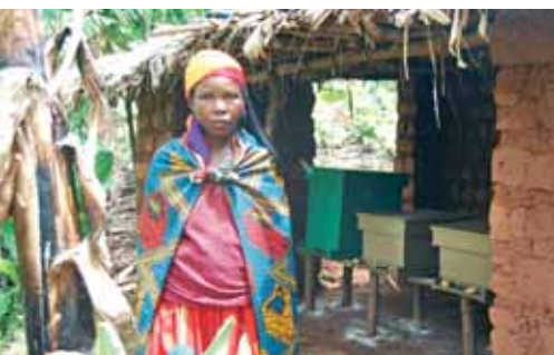
Les ruches du centre d'apiculture proviennent de la menuiserie

Le savoir-faire des formateurs suisses, l'originalité des modèles et la qualité de finition des meubles sont en phase de devenir une référence au niveau national !