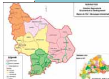
Rayon d'action pour l'hôpital ophtalmologique