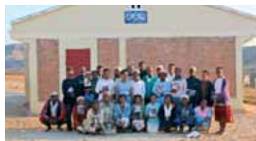
Les adultes de la formation nutritionnelle

Mais nous voulions aussi attaquer le problème de malnutrition à la base. Les habitudes alimentaires des familles qui vivent en brousse laissent à désirer. Nous avons décidé de leur faire goûter d'autres plats et de les motiver à utiliser des ingrédients plus variés. Une formation appropriée des parents peut résoudre bien des problèmes nutritionnels des enfants, nous en sommes convaincus.