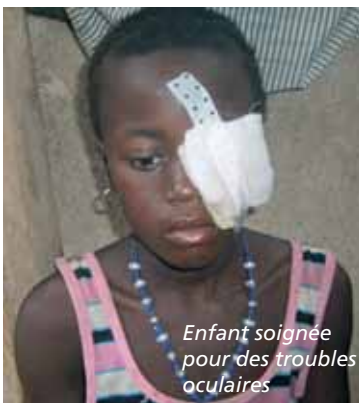
Enfant soignée pour des troubles oculaires

Ces chiffres ne suffisent pas pour décrire les difficultés sociales et économiques liées aux problèmes de la vue. La vie avec un handicap est dure, elle l'est encore plus dans un contexte où tout est précaire.