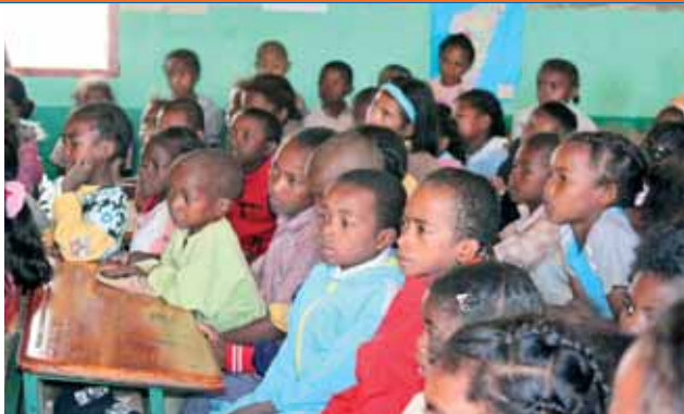
Les enfants de l'école

En septembre 2010, le SEL Projets élargissait le programme de soutien alimentaire à l'école d'Andranotaratra et lançait un appel pour de nouveaux Tickets-Repas. Ceux-ci devaient permettre de remplir la mission nutritionnelle que nous nous étions fixée (voir SPN 20)... et qui est en train de se réaliser grâce à vos dons !