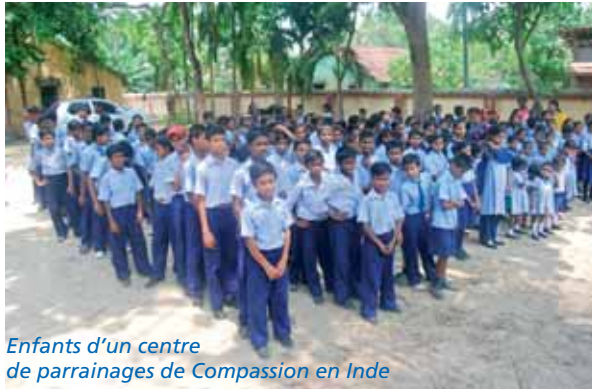
Enfants d'un centre de parrainages de Compassion en Inde

Vous êtes nombreux à avoir opté pour le « parrainage plus » que le SEL Projets propose, en collaboration avec son partenaire Compassion, à 35€ par mois au lieu de 28€. Mais au bout d'un moment vous vous posez peut-être la question : 7€ de plus, oui, mais pour quoi déjà ? En fait, les fonds supplémentaires récoltés alimentent une caisse commune pour soutenir des projets liés au parrainage mais dépassant le cadre du soutien individuel d'un enfant.