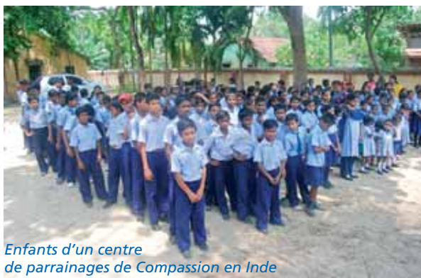
Enfants d'un centre de parrainages de Compassion en Inde

V ous êtes nombreux à avoir opté pour le « parrainage plus » que le SEL Projets propose, en collaboration avec son partenaire Compassion, à 35€ par mois au lieu de 28€. Mais au bout d'un moment vous vous posez peut-être la question : 7€ de plus, oui, mais pour quoi déjà ? En fait, les fonds supplémentaires récoltés alimentent une caisse commune pour soutenir des projets liés au parrainage mais dépassant le cadre du soutien individuel d'un enfant.