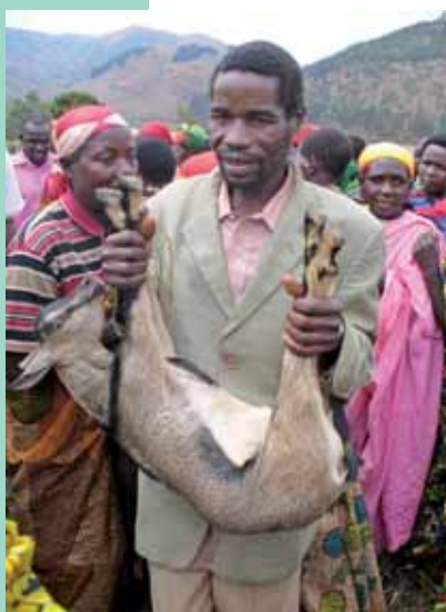
Distribution des chevres pour les activités génératrices de revenus