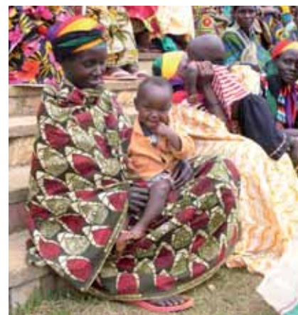
Fière de sa maman !

Propos recueillis par Pierre-Etienne Labeau